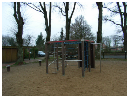
Schulhof in Weddelbrook