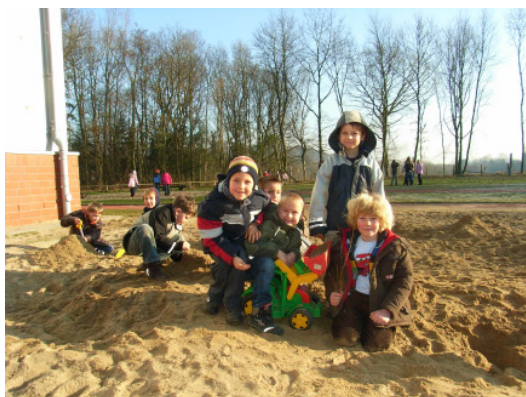
Schulhof in Hitzhusen

Der Weddelbrooker Schulhof liegt mitten im Dorf und ist von schönen hundertjährigen Linden umsäumt. Er verfügt über einen beliebten Bolzplatz mit zwei Fußballtoren, über Turnstangen und eine großzügige Kletterlandschaft.