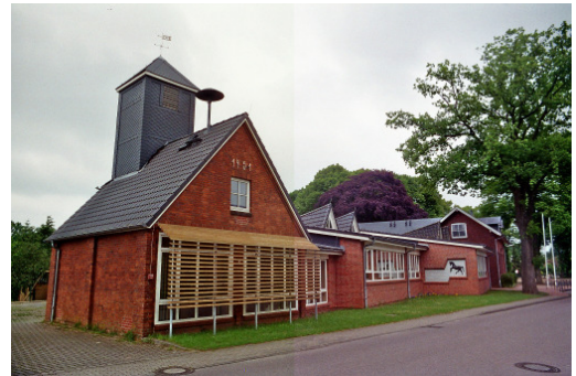
Schulgebäude in Weddelbrook