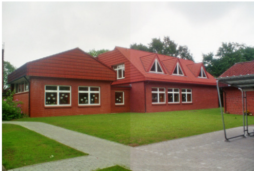
Schulgebäude in Hitzhusen

Im Jahr 2000 wurde das Grundschulgebäude in Weddelbrook saniert und um einen 260 Quadratmeter großen Anbau erweitert. Das Weddelbrooker Schulgebäude umfasst 3 Klassenräume und einen großen Mehrzweckraum, der sowohl für schulische Veranstaltungen genutzt wird als auch mittels einer Trennwand Platz für eine großzügige Schülerbücherei und ein Klassenzimmer bietet. Ferner stehen ein Musikraum, ein Lehrerzimmer, ein Gruppenraum, ein Elternsprechzimmer sowie ein Computerraum zu Verfügung.